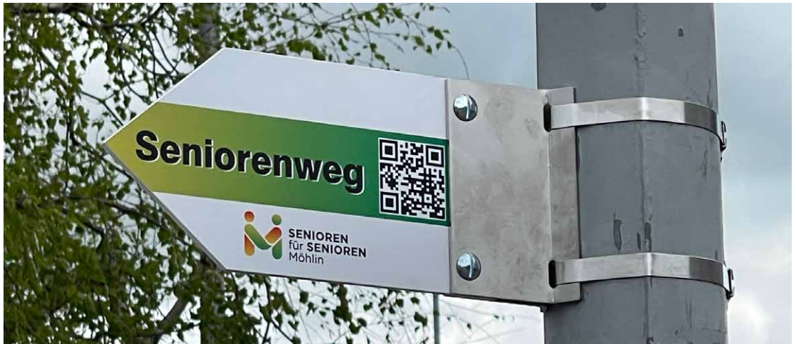
Seniorenwegweiser bei Spielplatzstrasse

Liebe Benutzerin, lieber Benutzer des Seniorenweges,